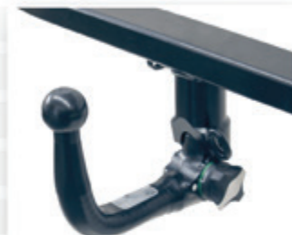
Detachable towball system

Established in 1923 in Alkmaar, the Bosal Group is Dutch registered, headquartered in Lummen, Belgium. The Bosal Group employs over 5500 people in 34 manufacturing plants and 18 distribution centers. Bosal Hungary is one of the most significant R&D and production facilities of the Bosal group.